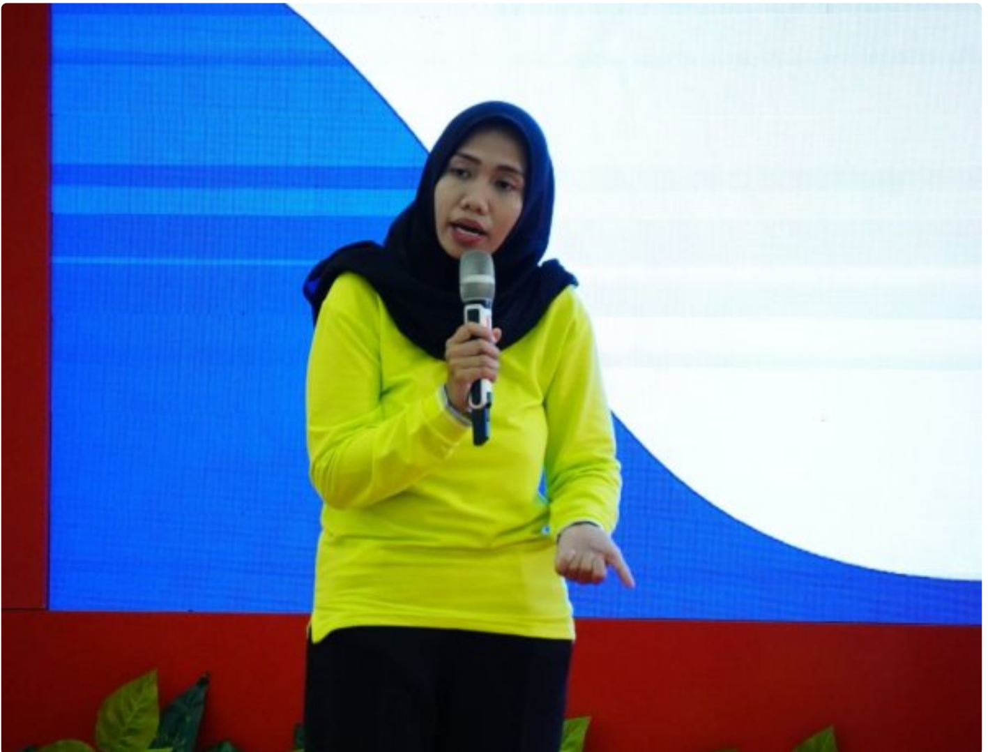
DWP Kemenkumham Jateng sampaikan Cegah Diabetes Melitus