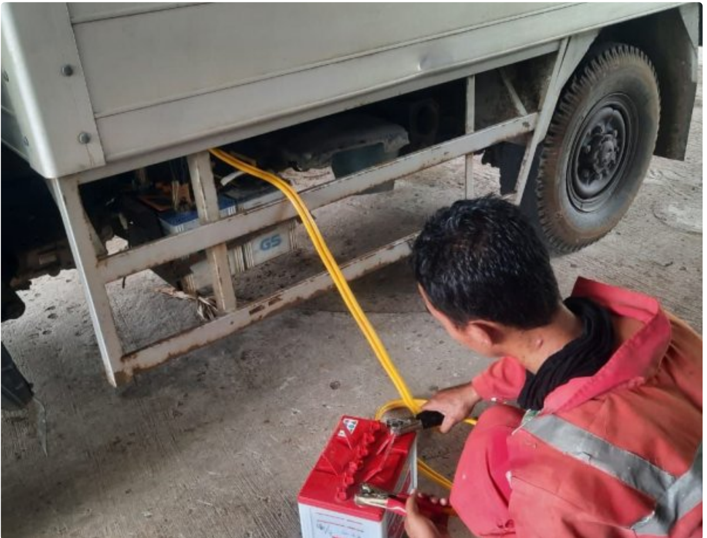
Petugas Staf Umum Lakukan Pengecekan